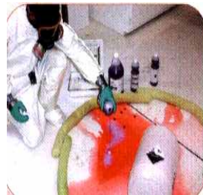
Liquid Acid 3-Color Change Process

應用：用於中和酸(鹼)性洩漏索造成的危害，可以變色顯示中和後洩漏液 PH 狀態，乾式的中和效能較濕式中和劑大，但濕式中和劑比較不會產生氣體及熱