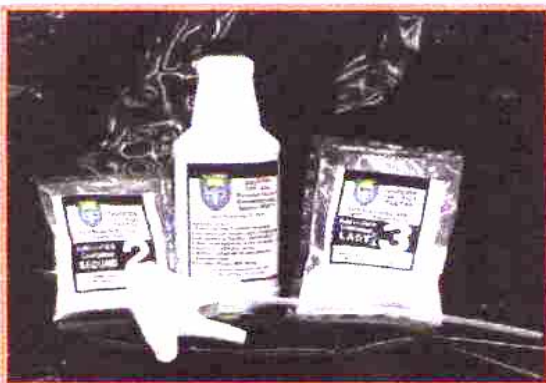
Personal Incident Decontamination System (PIDS)

應用：可中和及分解生物性及化學性的毒性，能有效地去除生化實驗室或第三級病毒的危害，可用於器材及環境，使用後對人體及環境皆無副作用