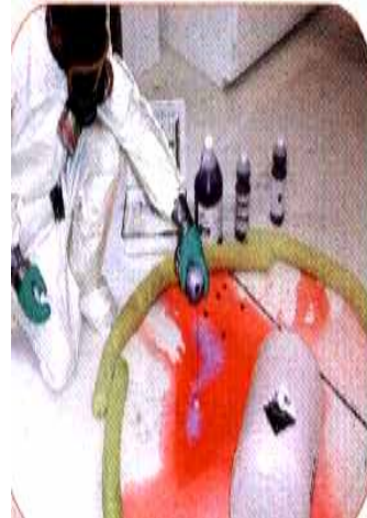
Liquid Acid 3-Color Change Process

規格：900 克(乾式)；960ml(濕式) 應用：用於中和酸(鹼)性洩漏所造成的危害，可以變色顯示中和後洩漏液 PH 狀態，乾式的中和效能較濕式中和劑大，但濕式中和劑比較不會產生氣體